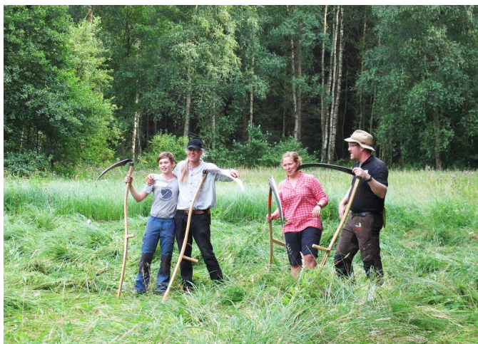
På engene i Bidstrup Skovene slår frivillige fra Danmarks Naturfredningsforening med le. Det øger biodiversiteten, skaber møder mellem mennesker og lærer nye generationer om glæden ved naturen.

klimatilpasningsprojekter og parker. Vi vil have mere rig natur, som skal bruges meget mere af institutioner og af skoler på alle niveauer. Naturvejledningen og -undervisningen har i denne proces en afgørende rolle, og de nye generationers viden og forståelse af natur, økologi og biodiversitets skal styrkes i folkeskolen af naturvejledere, biologilærere og undervisere.