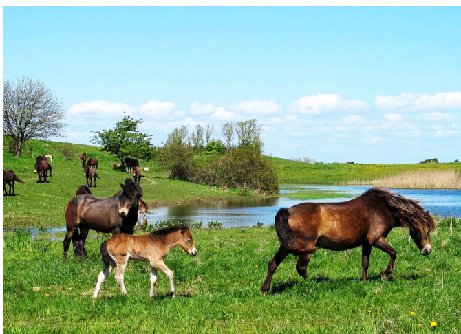
Ved at udsætte store planteædere til helårsgræsning, kan man genskabe naturlig dynamik i landskabet. Her ses robuste heste af racen Exmore græsse på Sydlangeland.

Den danske natur mangler dynamik. Alternativet vil sikre rammerne for vilde og selvoprettholdende økosystemer ved at genoprette naturens processer, f.eks. ved at udsætte store dyr til helårsgræsning som europæisk bison og elg, samt robuste kvæg- og hesteracer på statslige naturarealer inden for nogle store hegnede områder. Bævere skal udsættes for at skabe naturlig hydrologi. Store rovdyrarter som f.eks. ulv og guldsjakkal skal også sikres plads og beskyttelse, så de kan etablere og bidrage positivt til planteædernes bevægelsesmønstre i landskabet og holde bestandene af hjortevildt sunde.