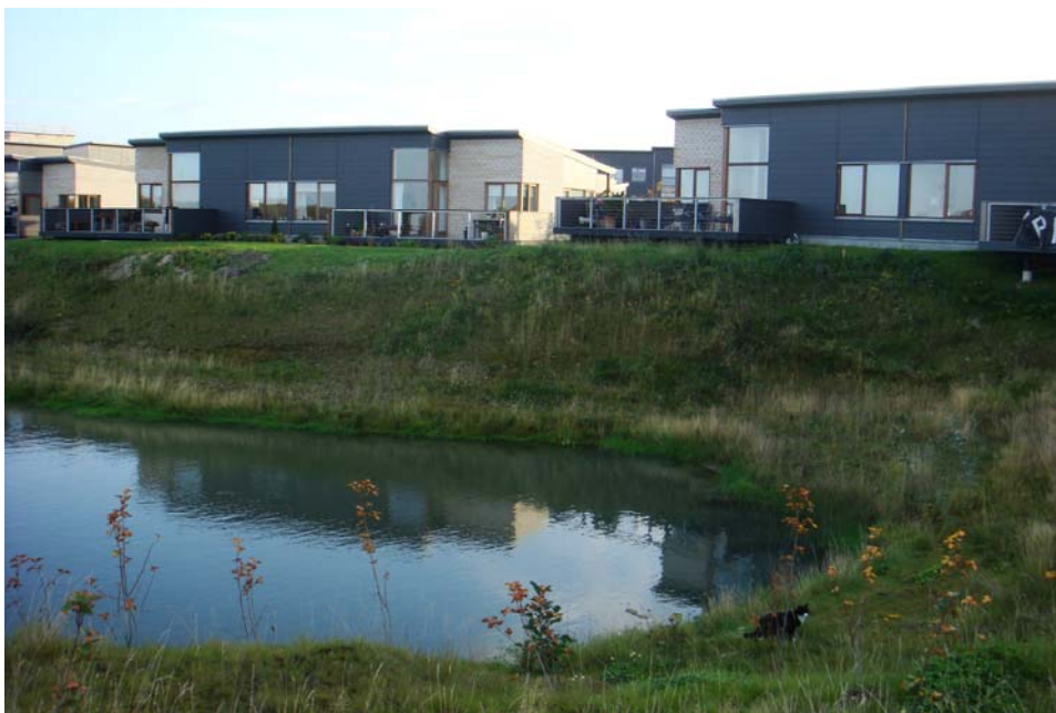
Figur 2: Håndtering af regnvand er iflg. politikerne et af hovedproblemerne i forhold til klimatilpasning. Her ses regnvandshåndtering i Stenløse.

Man kan dog diskutere, hvor langsigtede og visionære strategierne og målene er. Eftersom det i høj grad har været konkrete problemer med oversvømmelser, der har bragt klimatilpasning på dagsordenen (se afsnittet nedenfor om, hvorfor klimatilpasning kommer på dagsordenen), kan man argumentere for, at politikerne handler reaktionært på klimaforandringer frem for visionært. Det er også kun i et begrænset omfang, at politikerne er helhedsorienterede i den forstand, at de kobler klimatilpasning med andre sektorer end teknik og miljø. Håndteringen af regnvand og oversvømmelsestrusler fra havet er de eneste problemer, politikerne referer til i forbindelse med klimaforandringer.