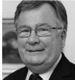
Claus Hjort Frederiksen (V) Finansminister