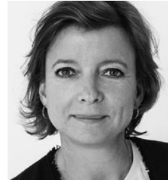
Karen Ellemann (V) Social- og Indenrigsminister