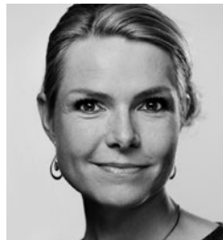
Inger Støjberg (V) Udlændinge, Integrations- og Boligminister