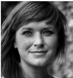
Sophie Løhde (V) Sundheds- og Ældreminister