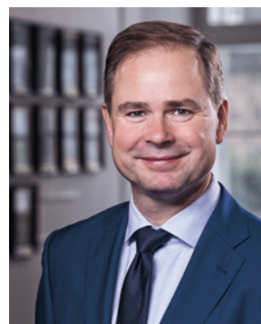
Nicolai Wammen Finansminister

Jeg vil gerne kvittere for det store engagement, der har omgivet arbejdet med denne handlingsplan. Tak til alle jer, der har givet bidrag og delt ud af jeres viden. Det samarbejde vi har haft, og fortsat vil have, er værdifuldt. For vi kan ikke løse den store opgave, som Verdensmålene repræsenterer, alene. Vi er nødt til at stå sammen.