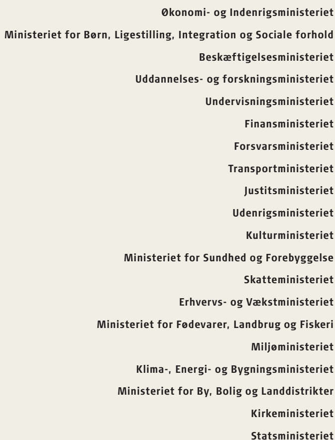
Kilde: Finanslovsforslag 2015 (drift, rammebelagt og anlæg).